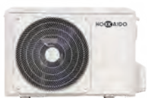
HCKU 471 Z2 HCKU 531 Z2

Unité extérieure - Jusqu'à 4 unités intérieures raccordables