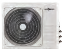
HCKU 601 Z3 HCKU 761 Z3