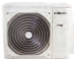
HCKU 810 Z4 HCKU 1060 Z4

A++/A+ (6,15~7,91 kW) | Classe d'efficacité énergétique en froid/chaud