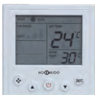
DTW IHXR Simply